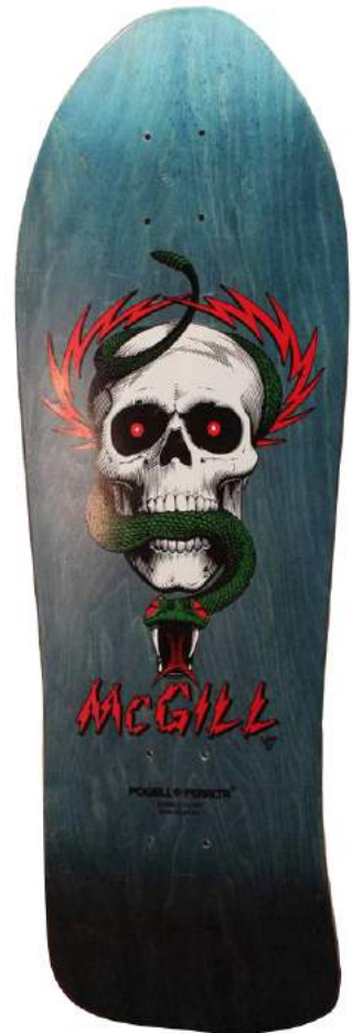
Powell Peralta (1987)