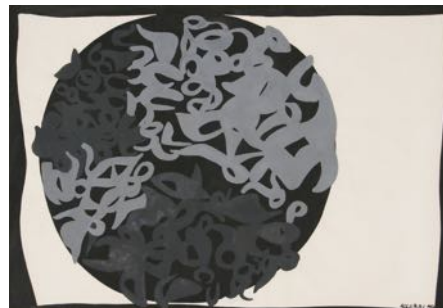
Carla Accardi, 1959